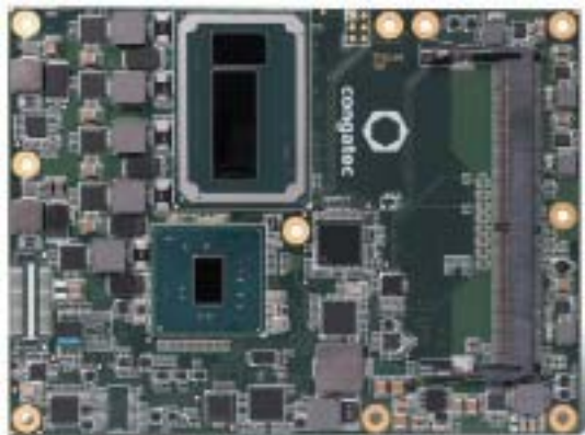
РИС. 2. ▼ Модуль COM Express Basic с процессором Intel Хеоп компании congatec

ленном секторе самый подходящий пример — Industry 4.0. В энергетическом сегменте промышленности их используют в «умных» электросетях для мониторинга ветряных электростанций или контроля микросетей, включающих различные локальные возобновляемые источники энергии. Особое значение такие серверы имеют в управлении производством с множеством составных компонентов. В сфере грузовых перевозок серверные технологии также широко распространены: в «умных» железнодорожных вагонах и локомотивах они предназначены для управления распределением грузовых запасов или информационно-управляющими системами. И конечно же, не в последнюю очередь данное оборудование предназначено для авиационной промышленности и авиаперевозок. В свою очередь, самоуправляемые автомобили тоже требуют наличия на борту мощного локального сервера. Аналогичное применение существует и в управлении другими транспортными средствами, в том числе передвижными автономными системами наблюдения. Другое целевое назначение — область видеонаблюдения, а также общедоступные цифровые рекламные и информационные носители. Кроме того, можно назвать и сферу здравоохранения, где IoT-устройства используются как в пределах медицинского учреждения, так и в домашних условиях для мониторинга состояния здоровья пациента. И напоследок — приложения для организации «умных» городов с управлением на уровне оператора, с вытекающими отсюда дополнительными возможностями, которые предоставляют IoT-устройства.