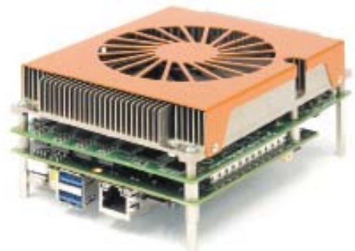
РИС. 3. ▼ Периферийный/туманный сервер, разработанный на сервере-на-модуле (размер 125×95 мм)

Все большее укрепление позиций в части встраивания нового класса модулей, связанное с выходом новой спецификации стандарта COM Express 3.0, — таков следующий шаг, предпринимаемый компанией congatec для развития описываемой технологии. Фактически первоначальное расположение контактов варианта Type 7 в дальнейшем будет использовано для специального применения данной спецификации этого стандарта в локальных и туманных приложениях. Основное внимание уделено увеличению запаса мощности для организации межплатформенных взаимодействий, вплоть до размещения на модуле порта Ethernet 10 Gigabit. Для этого будут установлены контакты от трех DDI-интерфейсов в контактной группе спецификации Type 6. Эта продуманная и значительная переработка устраняет необходимость в графическом интерфейсе для серверного чипа, который теперь не требует многочисленных выводов видео на несколько устройств в высоком разрешении. Как один из редакторов PICMG-спецификации, компания congatec принимает активное участие в разработке стандарта COM Express 3.0. ●