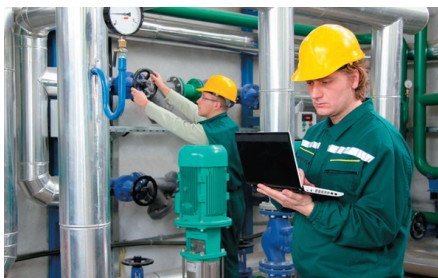
РИС. 1. ▼ Пример использования SnapVue на реальном объекте

Системы внутреннего (IPS) и глобального позиционирования (GPS) являются стандартными функциями практически всех современных мобильных устройств. Используя IPS или GPS, они могут определять свое текущее местоположение. При построении систем с поддержкой контекстно-зависимого HMI мобильное устройство обменивается информацией с мобильным сервером (на нем обрабатывается вся динамическая информация, зависящая от местоположения объекта). Сочетание данных о местоположении мобильного устройства и учетных данных пользователя (например, логина и пароля) позволяет системе в реальном времени «вычислить» роль и права конкретного сотрудника. В результате мобильное устройство способно предоставлять этому сотруднику необходимую информацию и давать ему доступ к элементам управления оборудованием, отфильтрованным по контексту, роли, правам и местоположению (рис. 1). Мобильный сервер определяет соответствующие действия и передает информацию