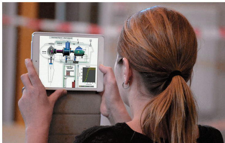
РИС. 2. ◀ Пример контекстно-зависимой мнемосхемы в SparVue, привязанной к близлежащему оборудованию

Знание мобильным сервером учетных данных работников и их текущего местоположения обеспечивает основу для контроля доступа. Например, когда подрядчик приходит на работу в качестве временного работника и ему требуется доступ к конкретной зоне, этот запрос становится известен мобильному серверу на основе близости человека к геотегу, связанному