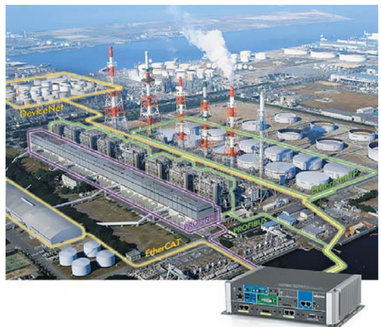
РИС. 3. ▼ Безвентиляторный компьютер NISE-300 в качестве шлюза