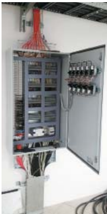
РИС. 1. ◀ Шкаф диспетчеризации ЦОД с использованием компонентов WAGO

Компания «АЗТ-Технологии» участвует в создании ЦОД различной сложности, в том числе предназначенных для суперкомпьютеров. Специалисты компании изучили системы автоматизации и диспетчеризации производства известных вендоров и в результате остановились на оборудовании линейки WAGO-I/O-SYSTEMS производства немецкой компании WAGO (рис. 2), поскольку оно позволяет включаться в системы