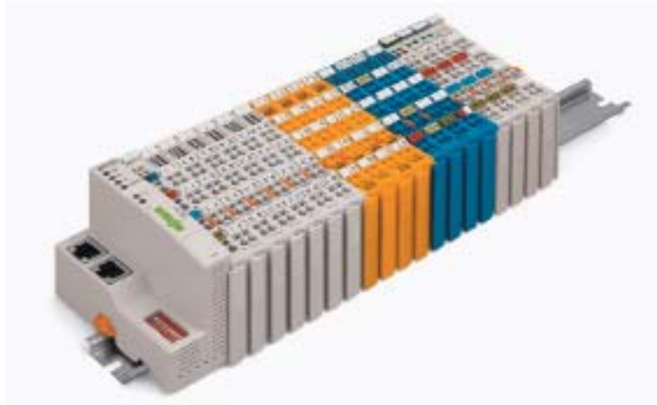
Рис. 2. ▶ Контроллер WAGO-I/O-SYSTEMS серии 750

диспетчеризации (мониторинга) ЦОД посредством протоколов MODBUS/TCP, BACnet, LON, KNX и пр. Построение сложных централизованных систем управления ресурсами и расчетными мощностями ЦОД компания «АЗТ-Технологии» осуществляет за счет поддержки оборудованием WAGO-I/O-SYSTEMS протокола SNMP, компонентов WEB-интерфейсов JAVA и HTML5. За счет этого контроллеры WAGO-I/O-SYSTEMS интегрируются в систему оценки нагрузок на инженерные системы при производстве мощных вычис-