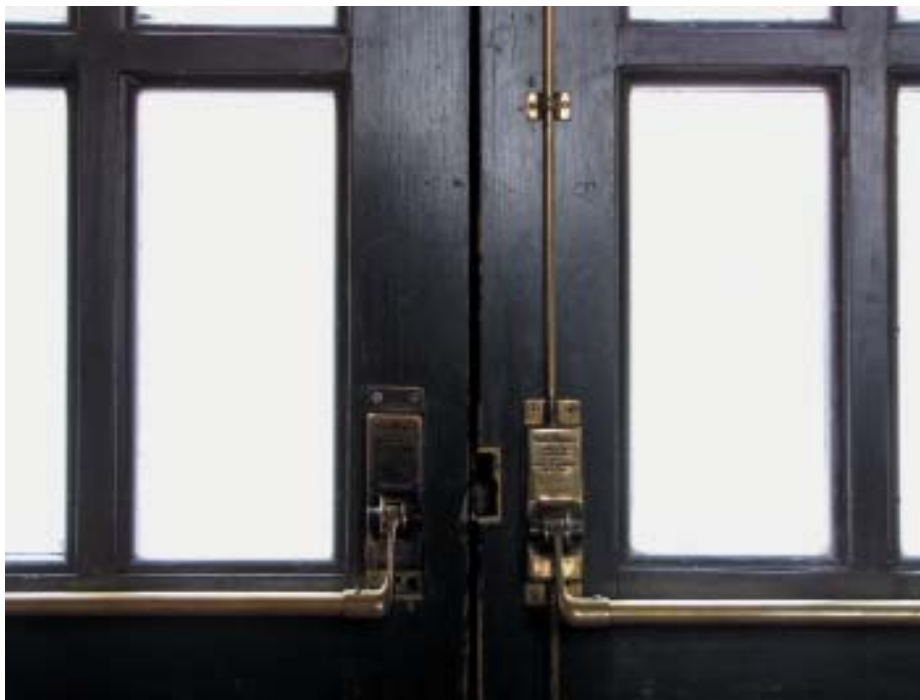
РИС. 1. ▾ Von Duprin: одно из первых антипаниковых устройств

В качестве примера можно привести решение от effeff, которое