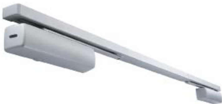
РИС. 3. ► Система марки ABLOY для противопожарных двухстворчатых дверей

В частности, система FD4xx, разработанная компанией ABLOY, работает следующим образом. На стене располагаются магниты, которые удерживают дверь от закрытия в обычное время. Как только срабатывает противопожарная