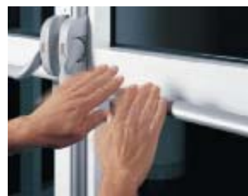
РИС. 5. ◀ Оборудование марки DORMA для эвакуационных и аварийных выходов

Как мы видим, сегодня на рынке представлен широкий спектр решений для оборудования как аварийных, так и эвакуационных выходов, которые позволяют сберечь жизни людей в условиях чрезвычайной ситуации. При этом вполне реально сохранить свободу перемещения по объекту, защитить себя и свое имущество от людей с нечестными намерениями. Что касается стоимости подобных решений, то по сравнению с сохраненными человеческими жизнями она весьма невысока и затраты эти служат благородной цели. ●