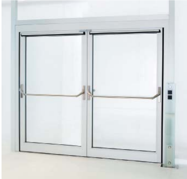
РИС. 4. ◀ Антипаниковое оборудование DORMA PNA 2500

Для аварийных и эвакуационных выходов DORMA предлагает широкий выбор антипаниковых устройств, соответствующих европейским нормам безопасности. Например, системы PNA 2000, PNB 3000 и PNA 2500 (рис. 4), обеспечивающие беспрепятственный выход, рекомендованы к применению в общественных местах, где возможно возникновение паники. Такая