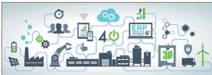
Рис. 3. «Индустрия 4.0»

Успех в реализации концепции «Индустрия 4.0» (рис. 3) на промышленном предприятии также во многом будет зависеть от выбора страте-