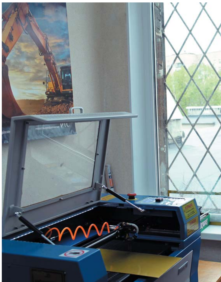
► Лазерный гравер в лицее № 244

Schools) в Великобритании. В этом году призерами разных номинаций Первого открытого всероссийского конкурса творческих работ школьников 3D Boom! стали все семь участников из ФМЛ № 30. Учащиеся лицея № 244 продемонстрировали работы по 3D-моделированию и прототипированию на выставке достижений, приуроченной к отчету главы администрации Кировского района, а затем на всероссийском фестивале в Москве «Робофест 2014».